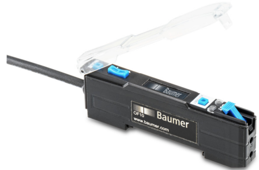
图片与实际产品类似