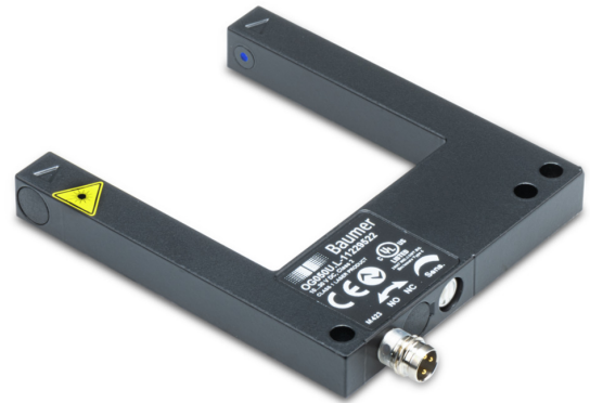
图片与实际产品相似